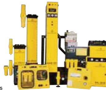
Breathing Air Purifiers

domnick hunter는 일인용 또는 다인용, 표면처리 공정과 도장공장 및 기타 다른 산업 공정에서 다양한 범위의 호흡 공기 정화 장치를 공급하고 있습니다.