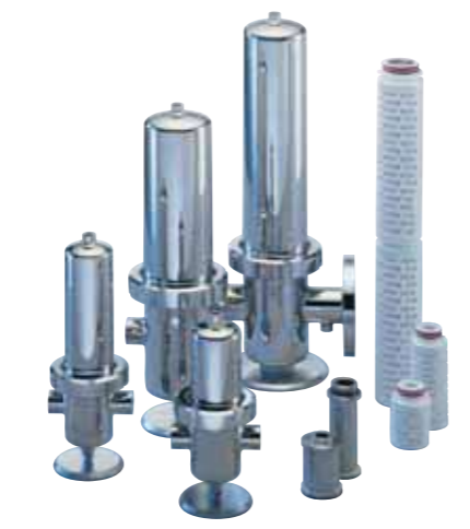
Food and Beverage Sterile Air Filters