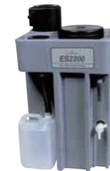
ES 2200 Oil/Water Separator

간단하고, 경제적이며, 환경적인 솔루션은 domnick hunter의 ES2000 유수분리기입니다. ES2000 유수분리기는 응축수 관리 시스템의 한 부분으로 설치되며, 모인 응축수의 오일 농도를 쉽게 줄일 수 있습니다. 이것은 또한 ISO 14000을 추구하는 회사에서 사용할 수 있습니다. 응축수의 오일 농도를 정해진 기준 이하로 낮출 수 있습니다. 전체 응축수의 99.9%를 깨끗한 물로 만들어서 배출 가능하게 하며, 또한 오일은 법적, 환경적으로 처리하도록 내부에 남게 됩니다.