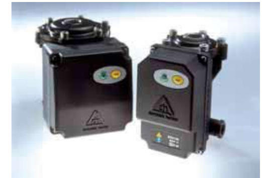
ED 2200 & ED 2100 Condensate Drains

ED2000 응축수 드레인은 모든 모델에 설치 가능하며, 응축수 제거에 있어서 신뢰성 있고, 쉽게 설치 가능한 운전 비용 절감 솔루션입니다.