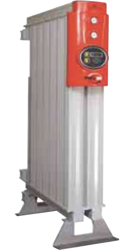
PNEUDRI MX Heatless Range Flowrates From 240 scfm (408 Nm³/h)