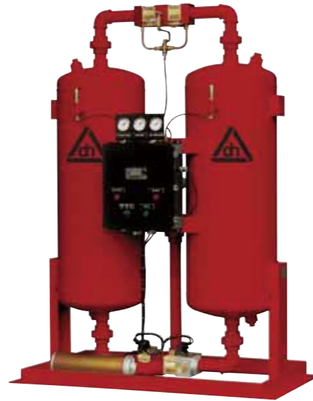
For pictorial purposes only