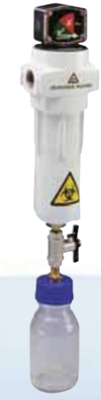
Medical Vacuum Filter

유가공식품 및 음료의 특정 공정에 적용할 수 있는 공기 멸균 문제 해결에 비용 절감 효과가 큰 솔루션을 제시합니다.