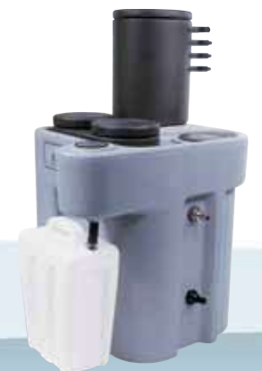
ES 2400 Oil/Water Separator

Seven models cover all compressed air applications