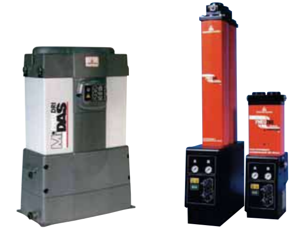
PNEUDRI MIDAS Flowrates From 3 scfm (5.1 Nm³/h)