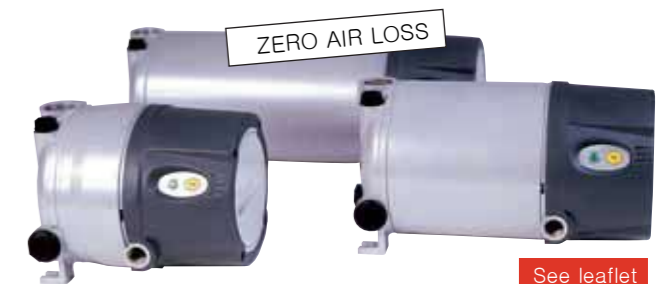
ED 2300/2400/2500 Condensate Drains