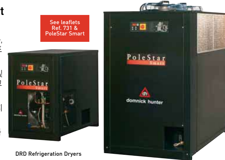
DRD Refrigeration Dryers