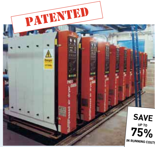
10 Bank Maxi PNEUDRI electronic installation

멀티뱅크 드라이어는 각 개별 뱅크가 유지/보수 시, 또는 압축공기 소모량이 감소가 되는 경우 쉽게 분리 가능하도록 설계되어 있습니다.